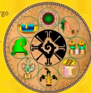
8 PUEBLOS AZTECAS HOY EN CDMX