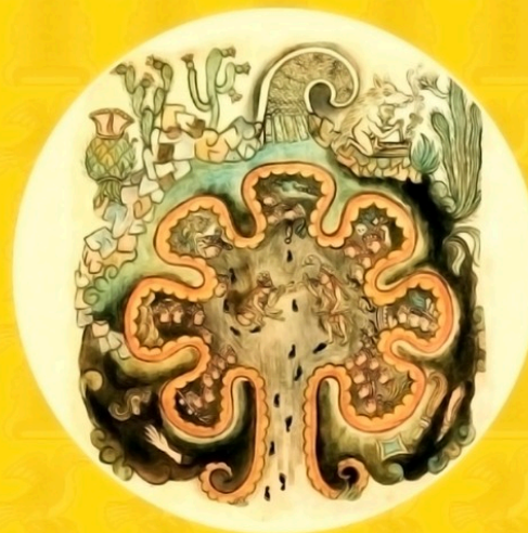
CHICOMÓZTOC EN EL CULHUACÁN

El 17 de abril de 2017 se publicó en la Gaceta Oficial de la Ciudad de México, en las páginas 26 a la 30, el Padrón de Pueblos y Barrios Originarios de la Ciudad de México con un total de 139 pueblos y 58 barrios.